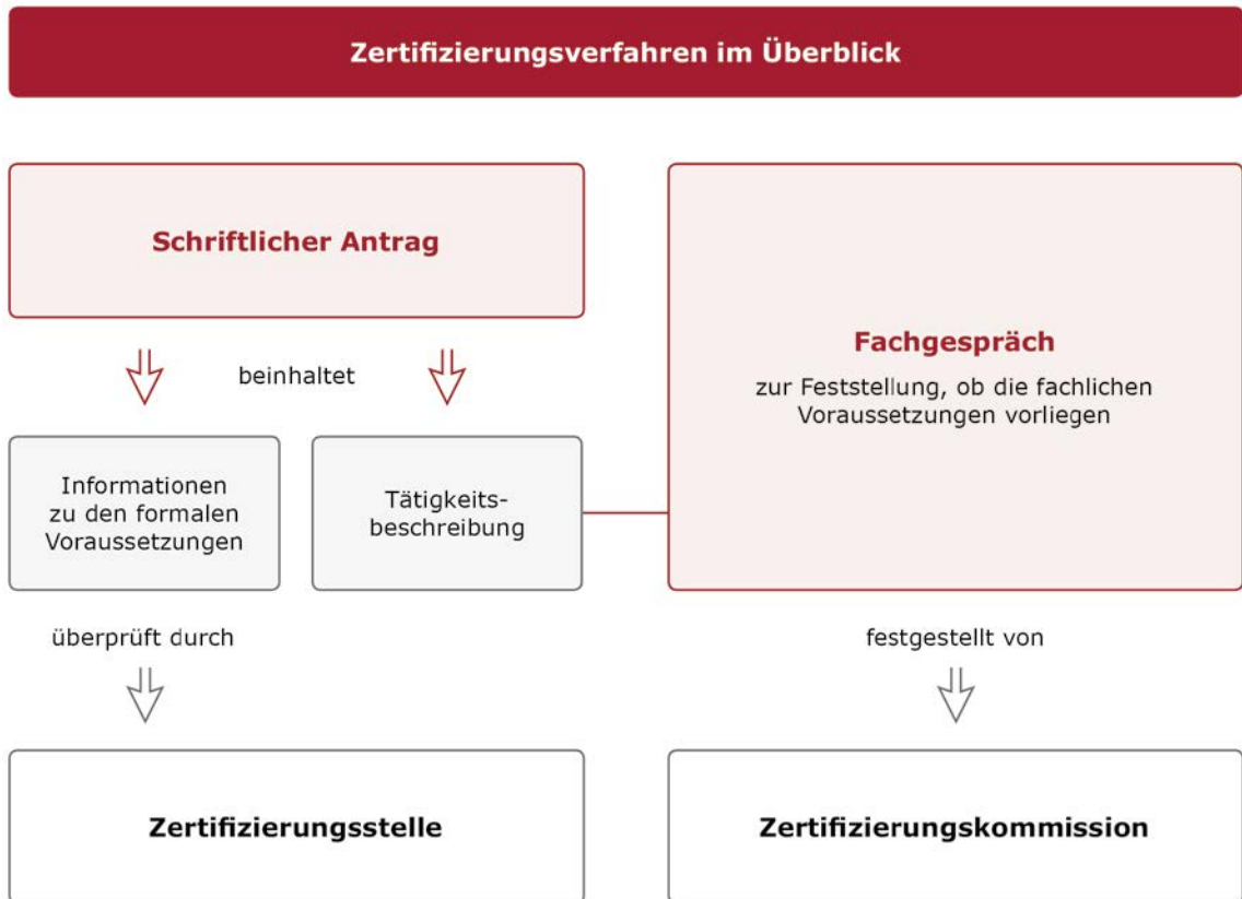
Abbildung 1: Zertifizierungsverfahren im Überblick

■ Fachgespräch: Das Fachgespräch bildet den zweiten Teil des Zertifizierungsverfahrens. Dieses findet zwischen dem/der Antragsteller/in und der Zertifizierungskommission statt. Die zwei Fachexperten/-expertinnen der Zertifizierungskommission stellen anhand von festgelegten Kriterien fest, ob der/die Antragsteller/in die fachlichen Voraussetzungen für den Erwerb der Ingenieur-Qualifikation erfüllt.